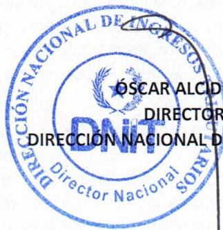
ÓSCAR ALCIDES ORUÉ ORTIZ DIRECTOR NACIONAL DIRECCIÓN NACIONAL DE INGRESOS TRIBUTARIOS